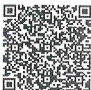
แบบรายงาน